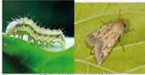
(دودة ثمار العنبر: الفراشة - اليرقات)